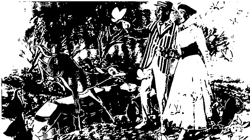
Julie Andrews et Dick Van Dyke dans Mary Poppins .

Dans la continuité, le film est un conte moral où l'enfance malheureuse reprend sa place au sein d'une famille compréhensive qui respecte le cerf-volant (objet du drame primitif, c'était pour le chercher que les enfants s'étaient sauvés) comme préoccupation majeure de leur existence d'enfant. Mais à y regarder de plus ou moins près, cette histoire de cerf-volant est une étrange affaire. D'ailleurs, du jour où Mary Poppins arrive chez les Burns jusqu'à son départ, il